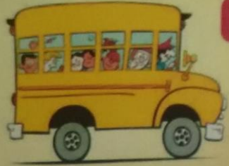
СХЕМА БЕЗОПАСНОГО МАРШРУТА ШКОЛЬНИКА